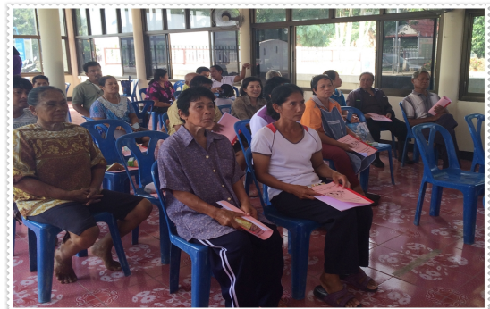
กรรมการสหกรณ์ฯ และเจ้าหน้าที่ จัดโครงการให้ความรู้เรื่องสหกรณ์ แก่สมาชิกกองทุนหมู่บ้านยาง หมู่ที่ 3 ต.หัวไผ่ อ.เมือง จ.อ่างทอง (14 พ.ย. 58)