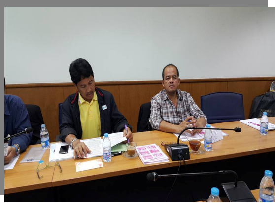
นายกสมาคม สสอป. เข้าร่วมประชุมคณะกรรมการอำนวยการ (ภาคเช้า) และนายกฯ พร้อมกับกรรมการ สสอป. ทำการประชุมคณะกรรมการ สสอป. (ภาคบ่าย) ณ ห้องประชุม ชสอ. จ.นนทบุรี (9 พ.ย. 58)