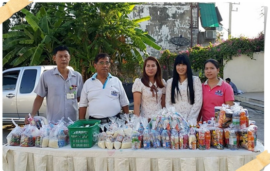
เจ้าหน้าที่สหกรณ์ฯ ร่วมทำบุญตักบาตรอาหารแห้ง ร่วมกับสหภาพแรงงานไทยเรยอน

- สมาชิกรอบ 5/2557 และ รอบ 2/2558 สสอป. เรียกเก็บเงินสงเคราะห์ล่วงหน้าปี พ.ศ. 2559 เป็นเงินคนละ 4,000 บาท